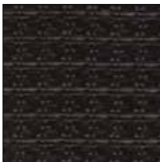
RAL 9005 Schwarz