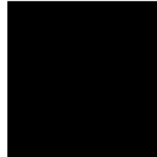
RAL 9005 Schwarz