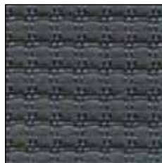
RAL 7040 Grau